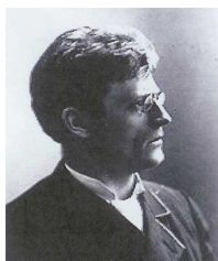
Knut Hamsun – 1890

Knut Hamsun (4 août 1859, Lom, Norvège - 19 février 1952, Norhølm, Norvège) est le nom de plume de Knut Pedersen, écrivain norvégien.